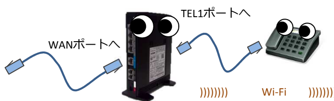
UCOM光電話ターミナルアダプター Wi-Fiルーター機能付き

Wi-FiはUCOM光電話のアダプタに貼ってあるSSIDとパスワードを設定すれば良いんだね!